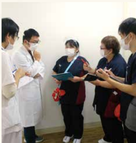
▲ 多職種からの意見を有難く受けています

若い頃は、「勉強は嫌い。」「看護師を辞めたい。」と思う方もいると思います。また、子育てをしながら通学や勤務をされている方もおられます。どのような状況でも、変わるチャンスはあります。「タイミングが悪い」「もう遅い」と諦めないでください。踏み出さなければ何も始まりません。何歳になってもチャレンジは止めないでほしいです。