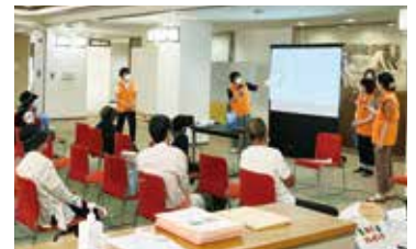
▲プレゼンテーションの様子