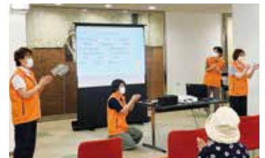
▲一緒に体を動かして頭の体操!

~100歳までおいしく食べて健康に過ごしましょう」(南大牟田病院)の3つの内容を実施しました。1病院20分間のプレゼンテーションを午前・午後の2クール行いました。各病院とも、来場された市民の皆様に喜んでいただけるようじゃんけんゲームや歌・体操なども取り入れ、工夫を凝らしていました。参加した方々は、一緒に体を動かしながら笑顔も見られ、楽しんでいただくことができました。