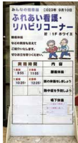
▲ふれあい看護コーナーご案内

14地区支部では、例年大牟田市内の施設が、ふれあい看護コーナーを担当しています。令和5年は「自分でできる健康管理」をテーマに、3病院が企画・準備を進めました。今回は、①「頭の体操をしましょう!」(大牟田天領病院)②「熱中症を予防しよう!」(みさき病院)③「嚥下体操