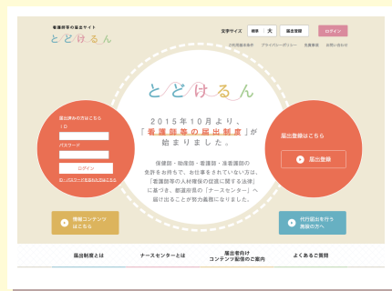
看護師等の届出サイト「とどけるん」

※「eナースセンター」への登録を希望すると、求職登録も同時に行うことができます。